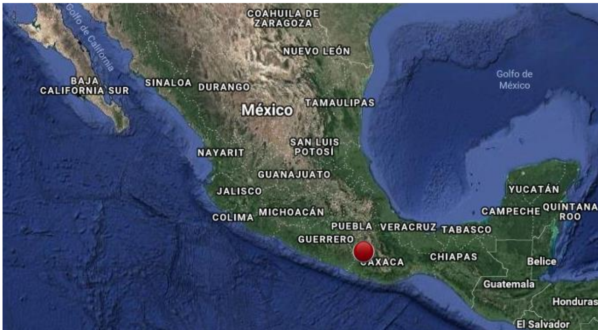
Figura 1. Mapa epicentral del Sismo del 16 de febrero de 2018, M 7.2 Oaxaca México.

El día 16 de febrero de 2018 a las 23:39:42 UTC, se registró un sismo de magnitud Mw 7.2. El Servicio Geológico Americano (USGS) localizó el evento a 37 km al noreste de Pinotepa Nacional, Oaxaca (Latitud: 16.646, Longitud: -97.653) a una profundidad de 24.6 km.