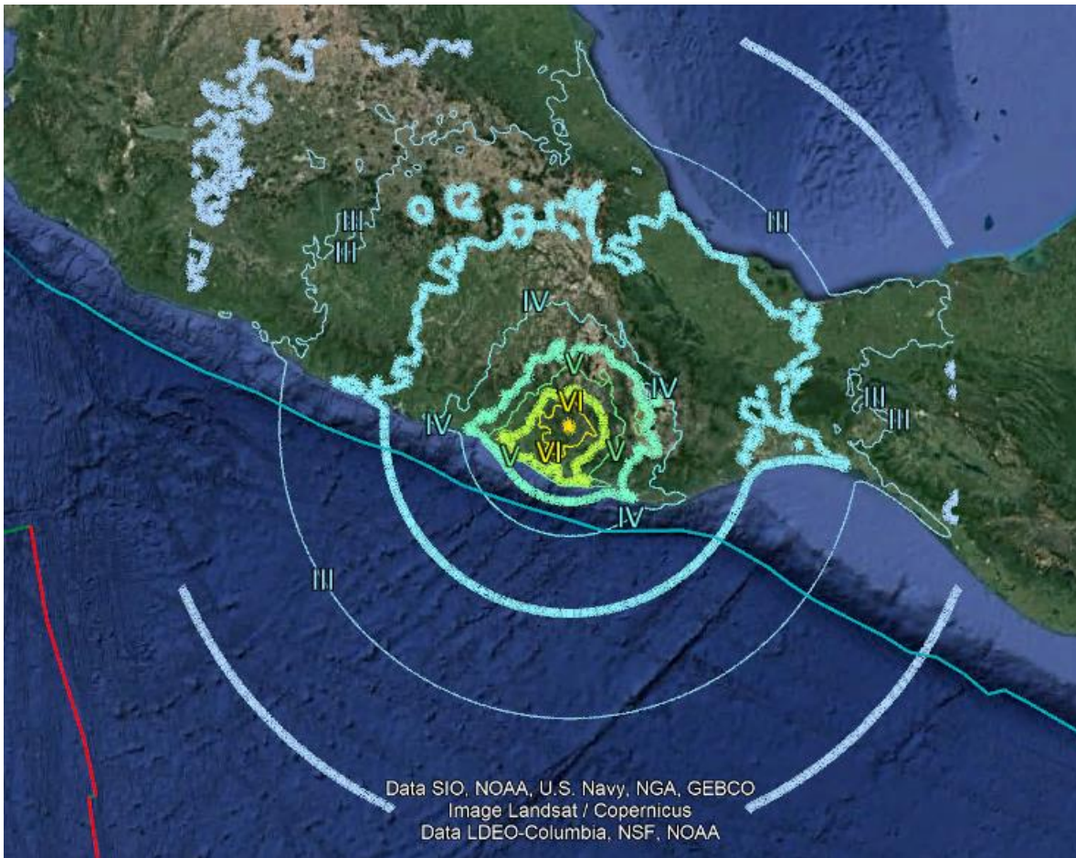
Figura 2. Mapa de Intensidades del Sismo del 16 de febrero de 2018, M 7.2 Oaxaca México.